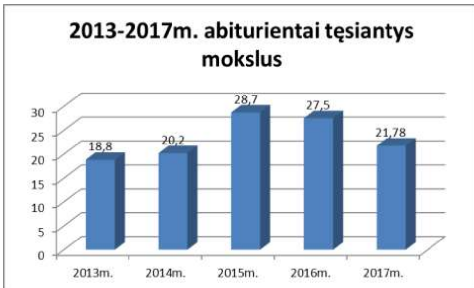
Pav.2. 2013-2017 m.m. abiturientai tęsiantys mokslus